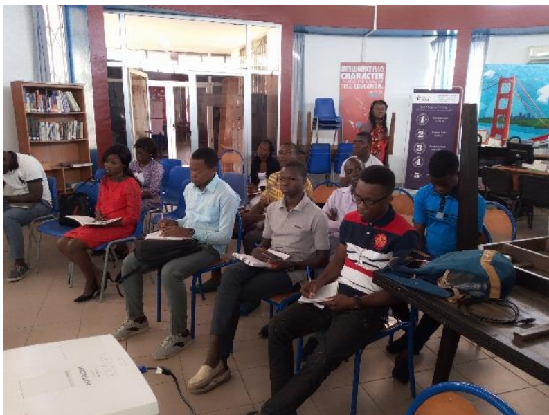
Participantes del Book Club, muy atentos al contenido expuesto por los panelistas.