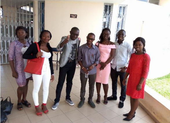
30 de marzo de 2019