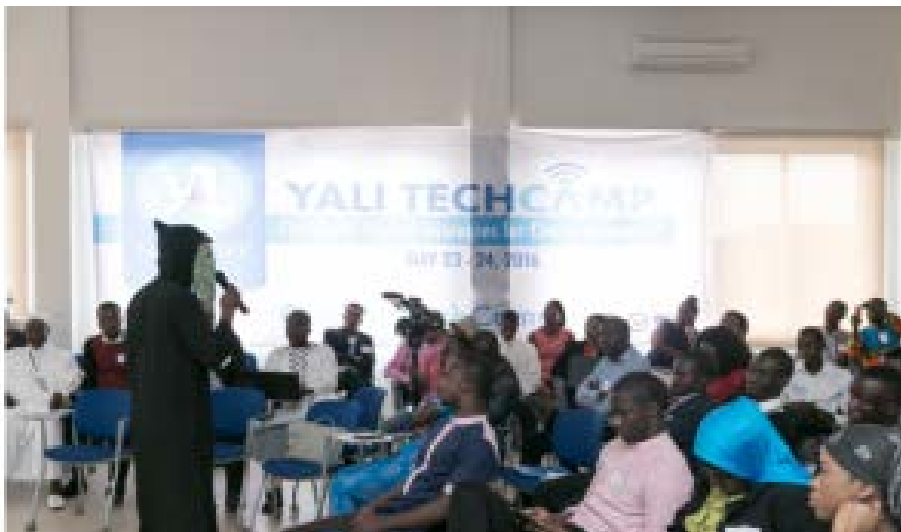
YALI Techcamp Ghana participants learn about low-cost technology tools and digital strategies to encourage participation in upcoming elections.